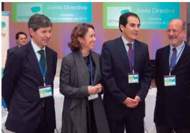
Los Alcaldes de Castellón, Logroño, Córdoba y Valladolid, tras la reunión de la Junta Directiva REC.

La Junta Directiva de la Red Española de Ciudades Inteligentes (RECI) aprobó recientemente en Córdoba la incorporación de seis nuevas ciudades: Almería, Arganda del Rey (Madrid), Mérida