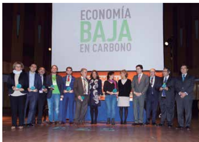
Los ganadores del VII Premio CONAMA, tras recoger sus trofeos.

En esta edición, el primer premio en la categoría de menos de 5.000 habitantes no ha sido para un Ayuntamiento, sino para una ONG: Amigos de la Tierra-Galicia. Esta organización gestiona desde hace 12 años el Centro de Educación Ambiental As Corcerizas, todo un ejemplo en la puesta en práctica de soluciones de vanguardia para conseguir otro modelo de desarrollo más sostenible. "Es una demostración de la viabilidad de una nueva