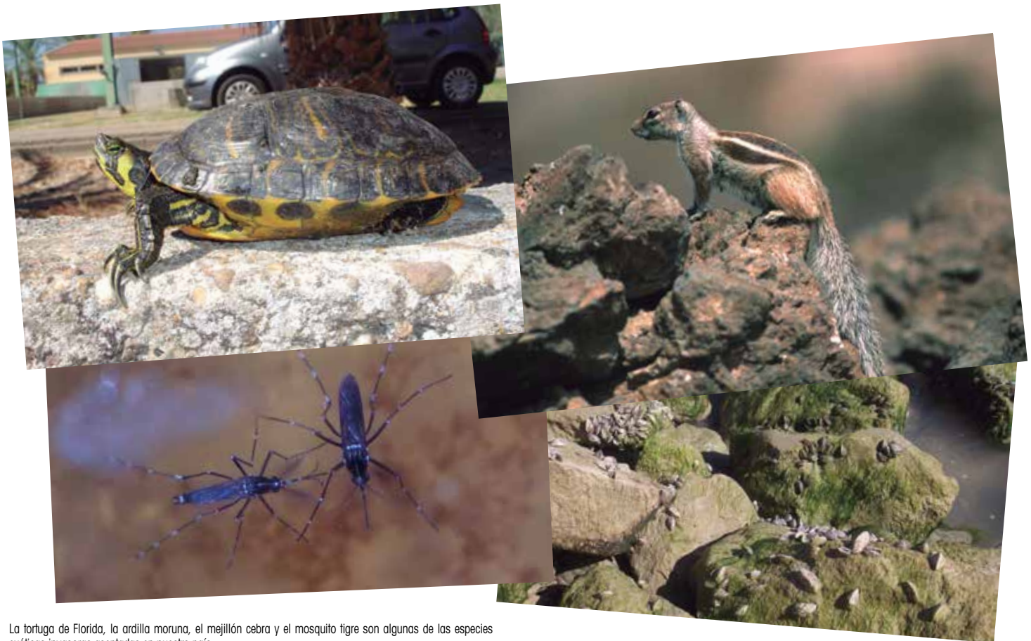
La tortuga de Florida, la ardilla moruna, el mejillón cebra y el mosquito tigre son algunas de las especies exóticas invasoras asentadas en nuestro país.

Así queda recogido en la Guía de Actuación para los Gobiernos Locales en relación con las Especies Exóticas Invasoras, un texto en el que se muestran las pautas y herramientas para que las Entidades Locales puedan actuar ante la proliferación de éstas. La Guía constituye, junto con un folleto explicativo, el cuerpo principal de la Campaña presentada en la sede de la FEMP en el marco de la jornada, en la que participó casi un centenar de asistentes.