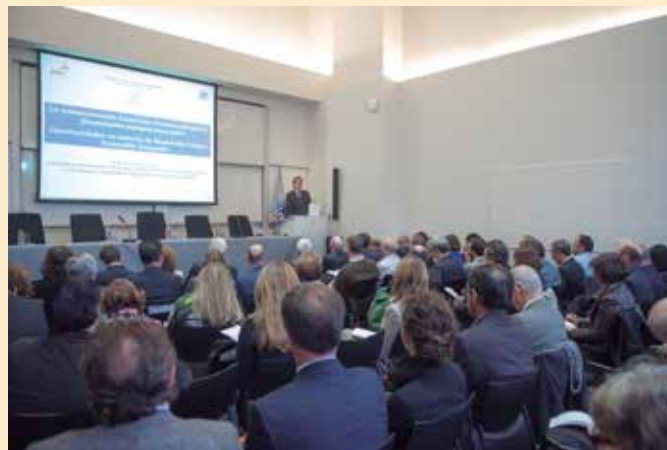
Intervención del Presidente de la FEMP, Íñigo de la Serna, en la jornada organizada por PwC, IE y la Federación.

Para lograrlo, puso a disposición de los Ayuntamientos el trabajo que está realizando la FEMP en este empeño, colaborando con el Ministerio y con la Comisión Europea y realizando importantes aportaciones al proceso de programación del tramo local de los fondos comunitarios.