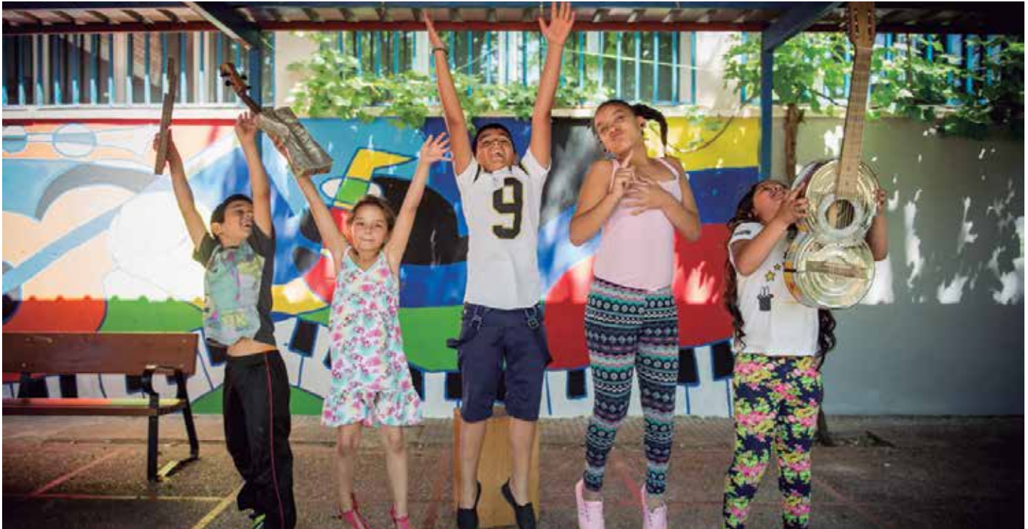
En esta iniciativa participan 80 niños de dos colegios madrileños.

La música y los valores medioambientales como instrumentos para ayudar a los más jóvenes con problemas de integración a sentirse útiles y aprender de nuevas experiencias. Esta es la iniciativa lanzada por Ecoembes en la que están implicados 80 niños nuevos músicos y que ya está a punto de empezar a sonar.