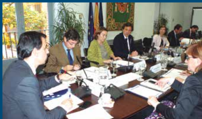
La Junta de Gobierno aprobó la declaración del Día Internacional de la No Violencia contra las Mujeres.

En este año 2014, la Declaración emitida hace hincapié en el Convenio de Estambul, acuerdo del Consejo de Europa sobre prevención y lucha contra la violencia hacia la mujer y la violencia doméstica, que nuestro país asumió el pasado agosto y que se configura como el primer instrumento vinculante de ámbito europeo en esta materia.