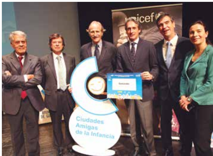
Íñigo de la Serna, tras recibir el diploma acreditativo de su Ayuntamiento.