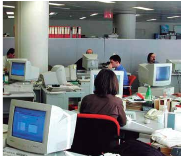
La FEMP formula diversas propuestas relativas a la actual limitación de la tasa de reposición de efectivos en la Administración Local.

De igual forma, en lo que se refiere al destino del superávit para inversión financiera sostenible, pide que en el supuesto de que un proyecto no pueda ejecutarse íntegramente en 2015, la parte restante del gasto comprometido pase al ejercicio 2016, siempre que se financie con cargo al remanente de 2015 y que la Entidad Local no incurra en déficit al final del segundo año.