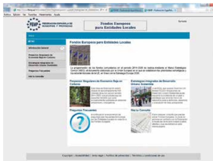
La FEMP ha habilitado en su web una Oficina de Información sobre Fondos Europeos para Entidades Locales.

Aunque históricamente sólo los municipios más grandes tenían posibilidad de presentar proyectos a Fondos Europeos, desde la FEMP se insiste (ver en el cuadro adjunto las declaraciones del Presidente, Íñigo de la Serna) en ampliar este abanico también a los municipios intermedios, en la medida que suelen ser los motores de desarrollo económico de sus territorios, o incluso a los pequeños, a través de órganos supramunicipales como Diputaciones Provinciales, Cabildos o Consejos Insulares.★