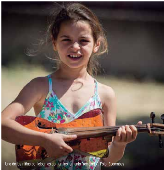
Una de las niñas participantes con un instrumento "reciclado".