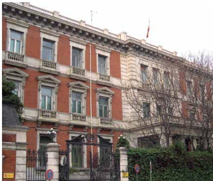
El MINHAP también ha emitido la Orden que regula los plazos para el suministro de información.

Por otro lado, y cuando se den las circunstancias que impliquen la elaboración de un Plan Económico Financiero, la Entidad Local remiti-