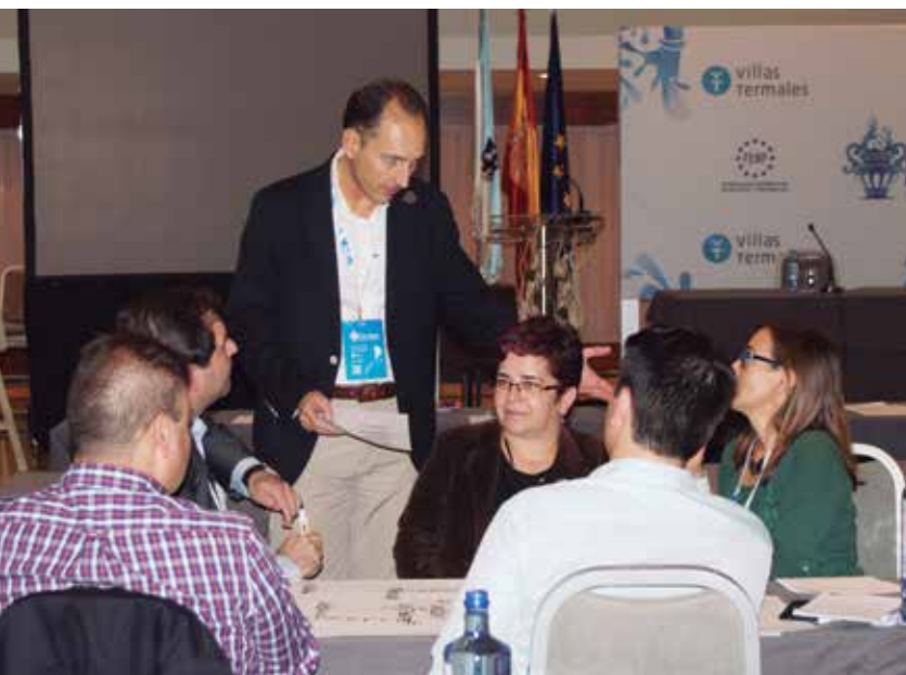
Uno de los talleres de trabajo que tuvieron lugar en O Grove.

ampliaría el conocimiento general sobre la existencia de estos recursos, que en muchas ocasiones pasan desapercibidos salvo en el caso de los balnearios más famosos.