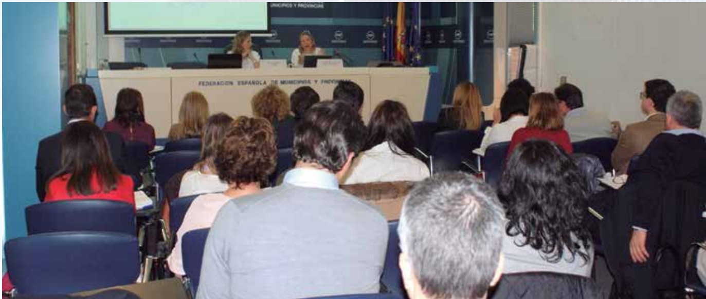
La sede de la FEMP acogió la celebración de uno de los cursos para técnicos municipales.