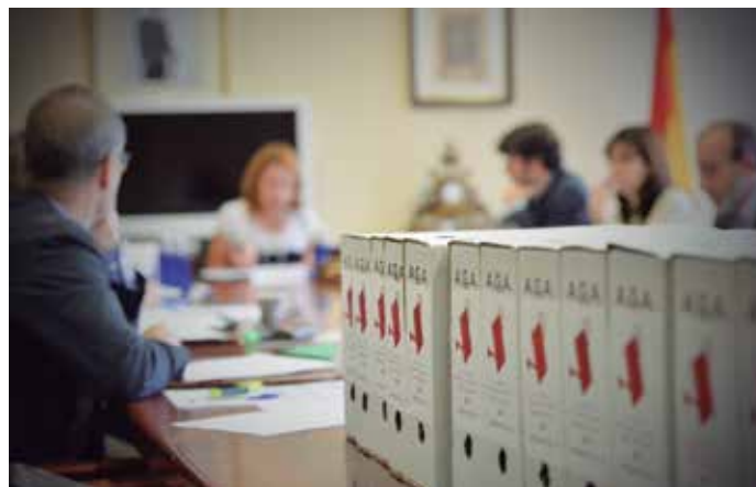
Se seleccionarán los mejores de los 608 proyectos presentados.

Recibieron menciones especiales la Biblioteca Municipal de Lobón (menos de 5.000 habitantes), la Biblioteca Municipal de Ermua (de 5.001 a 20.000 habitantes), y la Biblioteca Municipal Almudena Grandes de Azuqueca de Henares (de 20.001 a 50.000 habitantes).