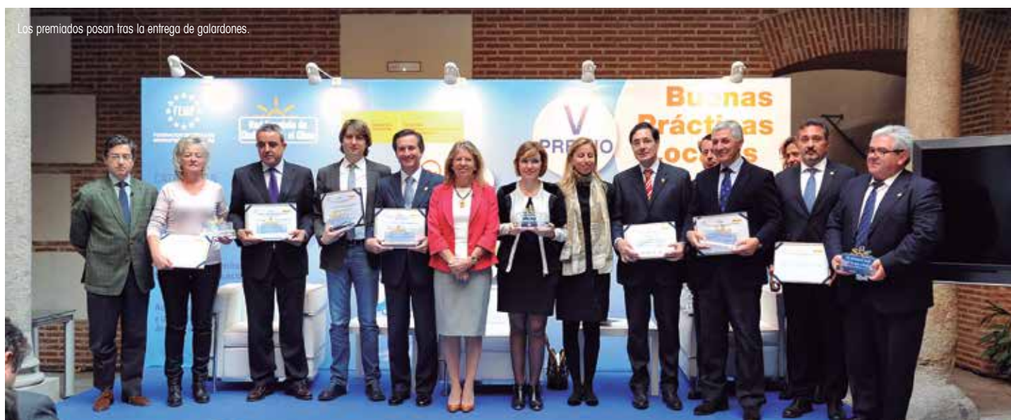
Los premiados posan tras la entrega de galardones.