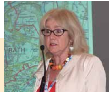
Cherry Beath, Alcaldesa de Bath (Reino Unido)