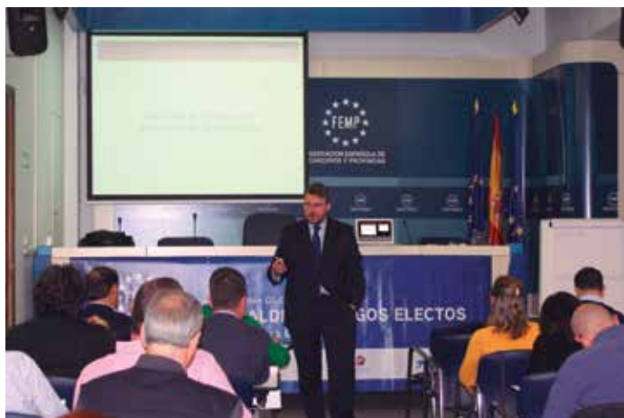
Última acción formativa del Programa, celebrada en noviembre en la sede de la FEMP.

Precisamente, la última de las ediciones de este curso fue la que cerró el programa de 2014, los días 27 y 28 de este noviembre, en la sede de la FEMP. Dirigida por Daniel Ureña, los contenidos fueron impartidos por